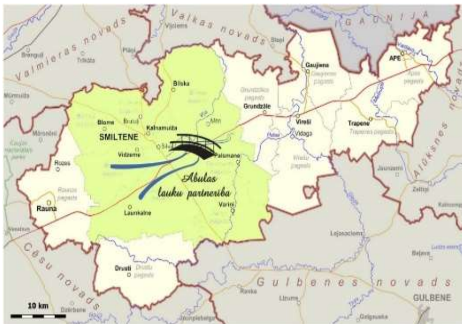
2. attēls. Abulas LP darbības teritorija Smiltenes novadā