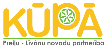
Jaunais “Preiļu – Līvānu novadu partnerības “Kūpā”” logo.

Tālāk tekstā “Preiļu – Līvānu novadu partnerība “Kūpā”” tiek minēta kā “Preiļu rajona partnerība” dokumenta sadaļās, kas attiecināmas uz VRG darbību līdz 2023.gadam.