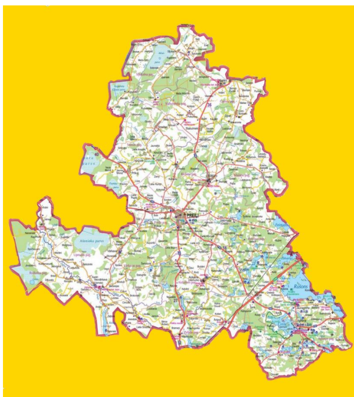
1.attēls. Preiļu - Līvānu novadu partnerības "Kūpā" darbības teritorija.

Līvānu novadā – Līvānu pilsēta, Jersikas pagasts, Rožupes pagasts, Rudzātu pagasts, Sutru pagasts un Turku pagasts.