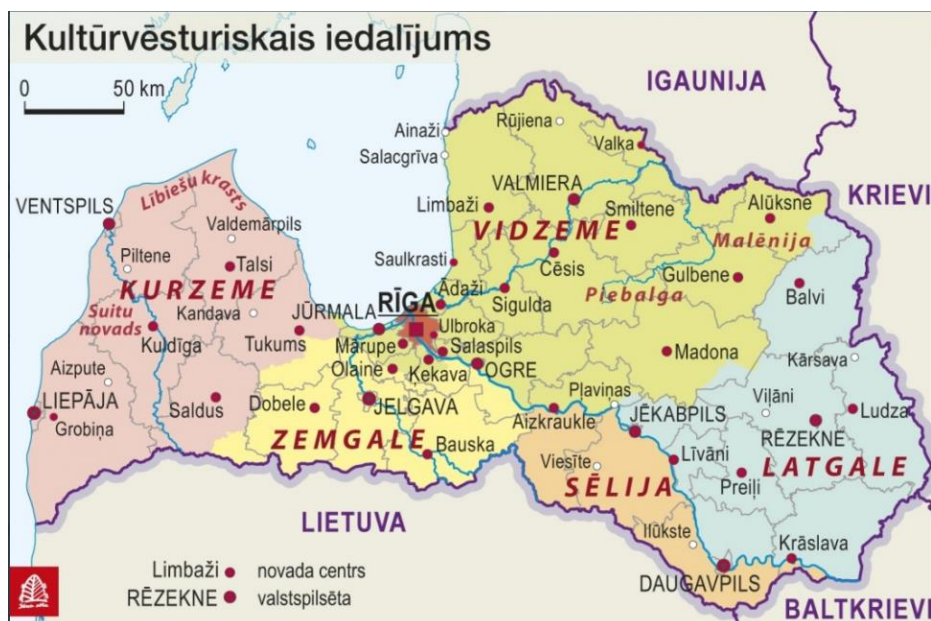
2.attēls. Latviešu vēsturiskās zemes.

VRG darbības teritorija robežojas ar Zemgales un Vidzemes vēsturiskajām zemēm. Vēsturisko zemju attīstības plāns ir nacionāla līmeņa vidēja termiņa attīstības plānošanas dokuments, kas uz septiņiem gadiem nosaka no Nacionālā attīstības plāna un politikas pamatnostādņēm izrietošus uzdevumus latviešu vēsturisko zemju identitātes, kultūrvēsturiskās vides un kultūrtelpu saglabāšanas un ilgtspējīgas attīstības veicināšanai, paredzot juridiskus, administratīvus, organizatoriskus pasākumus, kā arī to finansiālo nodrošinājumu. Arī VRG savās rīcībās uzskata par lietderīgu stiprināt vēsturisko zemju identitāti un sadarbību starp vēsturiskajām zemēm gan teritorijas ietvaros – starp Sēliju un Latgali, gan izvēloties sadarbības projektu partnerus no citām teritorijām.